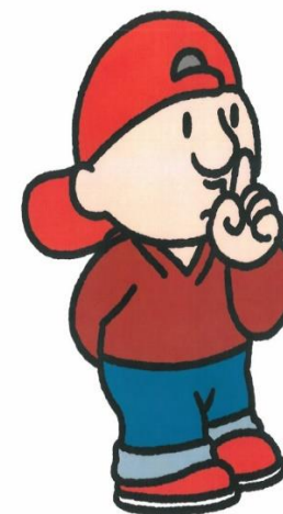
IK HOU MIJN MONDJE DICHT