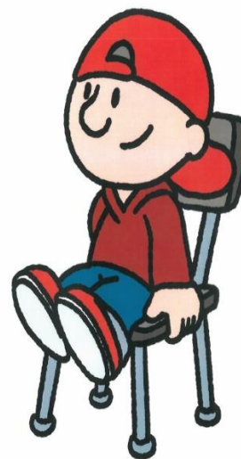
IK BLIJF ZITTEN