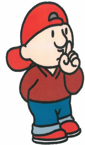
IK HOU MIJN MONDJE DICHT