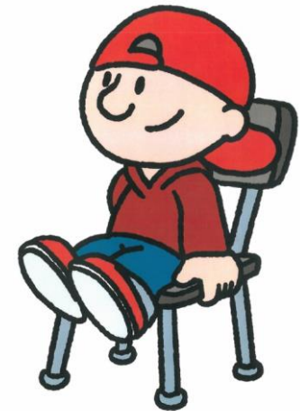
IK BLIJF ZITTEN