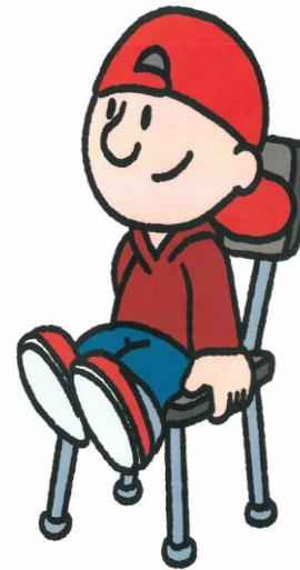
IK BLIJF ZITTEN