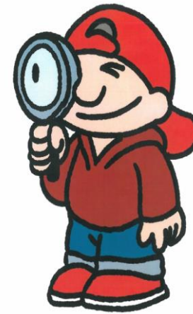
IK KIJK NAAR DIEGENE DIE VERTELT